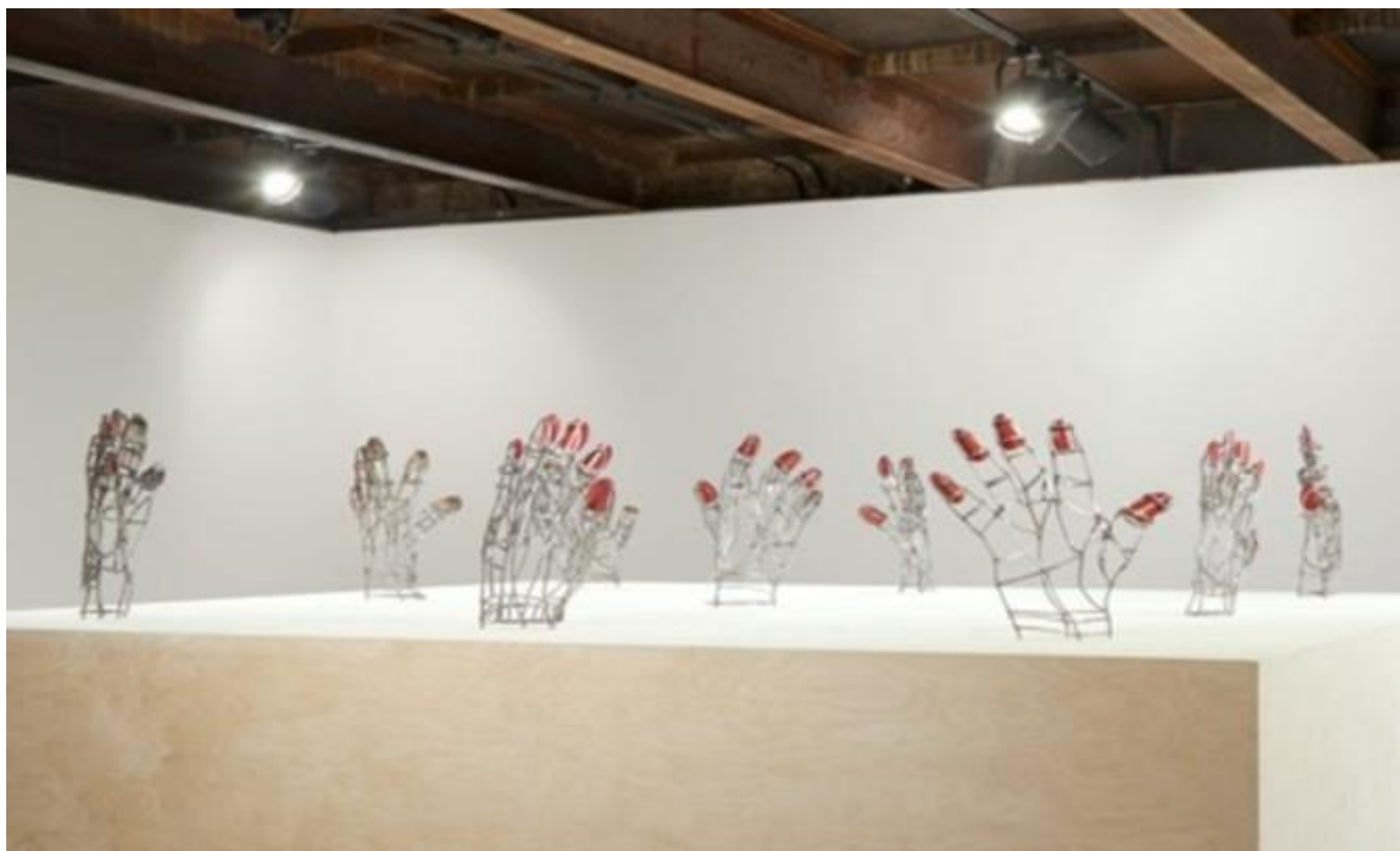
©Teresa Burga Déplier le corps (social) féminin Unfolding the (Social) Female Body, Art Article de A. López (2014)