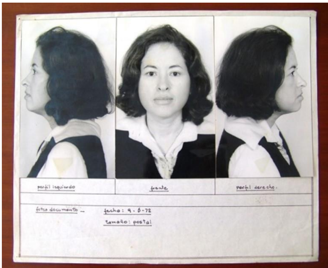
Teresa Burga, Autoportrait. Structure. Report, 9.6.1972, 1972 Technique mixte et Installation avec dessin, photographie, documents, résultats d'électrocardiogrammes et phonocardiogrammes, objets lumineux et sons. 40 linéal ft. (12 linéal m) M HKA Collection Flemish Community © Teresa Burga

Teresa Burga cuestiona las nuevas estrategias de l'art conceptual a través l'autoportrait, lugar mayor de transformaciones y de renovaciones de l'art peruano, consolidando las nuevas tendencias de esta época. Sus obras son basadas sobre los reportes, las descripciones, los esquemas que documentan las acciones y las proporciones que respetar, que utilizan los gráficos para relire su imagen y su entorno. En otros casos, estos documentos sirven de códigos que traducen una realidad y los idiomas diferentes de los que nosotros estamos sometidos diariamente. Burga presenta como una encuesta policial un estudio detallado de sus propios rasgos, de su propia identidad. Al estudiar cada milímetro de su rostro, ella identifica las líneas principales y los espacios que lo estructuran, y los transcribe más tarde en gráficos que, sumados, dan un valor lineal total que ella