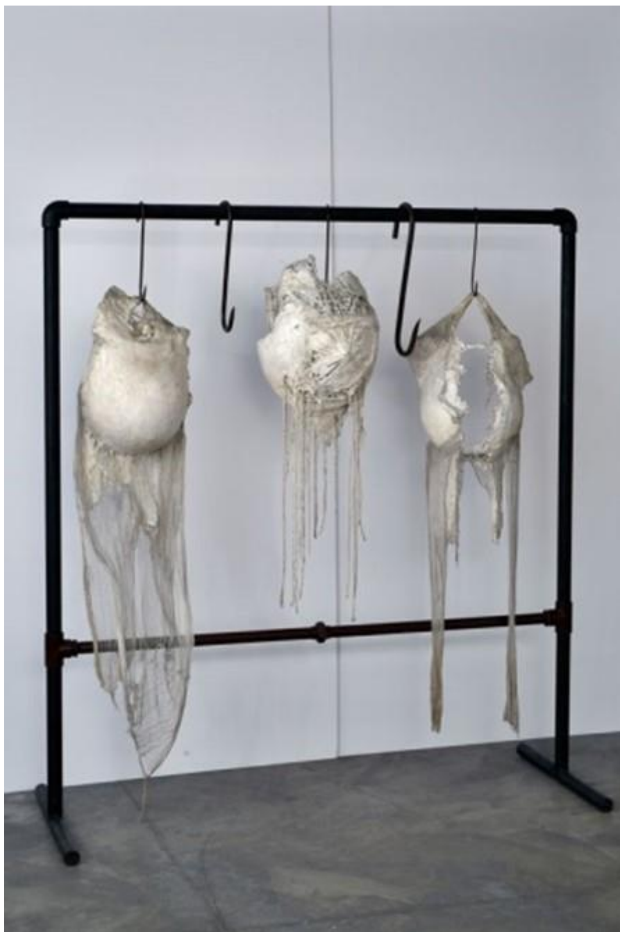
Johanna Hamann Barrigas (Ventres), 1973 Sculptures et structures en métal, plâtre et résine 68 ½ x 63 x 23 5/8 in (174 x 160 x 60 cm) Collection Musée d'Art de Lima

L'exposition Radical Women : Latin American Art, 1960-1985 , est présentée au Hammer Museum de Los Angeles en octobre 2017, sous la direction et le commissariat de Cecilia Fajardo Hill et Andrea Giunta. C'est le corps dans toutes ses dimensions, internes et externes, constituant une iconographie qui exprime le réel, le poétique et le métaphorique que les